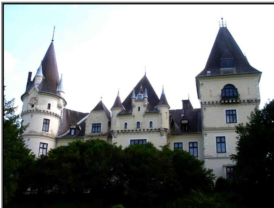
Kép 12: A tiszadobi kastély

kastély mögött látványos, nyírott sövényből kialakított labirintus is található. A kastélypark egy szakasza a Holt-Tiszával érintkezik, így vizen is megközelíthető.