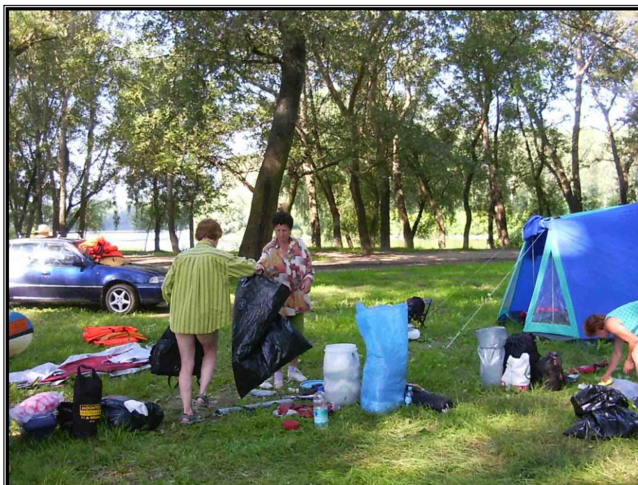
Kép 9: Pakolás, pakolás...Itt éppen Tiszadadán

A sátor állítással és bontással analóg napi feladat volt a bepakolás és a kikapolás. Részben a hajókból kellett esténként az összes holmit kirámolni, reggel pedig visszatömködni, részben a csomagokat kellett módszeresen szétteríteni a sátorban, reggel pedig begyömöszölni a hordókba, táskákba, szatyrokba. Nem tudom kinek mennyire sikerült, nekem kellett vagy három nap, mire optimálisan tudtam összerakni a holmikat (az első napokban néhány menet közben szükséges dolog természetesen az autóba berakott csomagban lapult), és még emlékeztem is rá, hogy végülis mit hova tettem. Ez utóbbi sem volt kis eredmény.