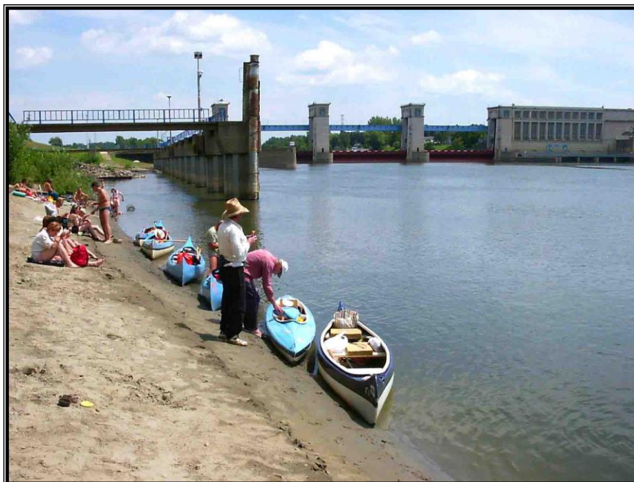
Kép 7: Túl a zsilipelésen (Tiszalök)

sugárban, mintha falicsapból folyna, ezért el kellett egy kicsit tartani a hajót a faltól, nehogy ott álltó helyünkben megteljen a hajó vízzel. Ráadásul tiszta sár és iszap lett a kezem és a kesztyűm a lejjebb lévő, korábban víz alatt álló létrafokoktól. De túléltük és még a kezem sem nyúlt meg.