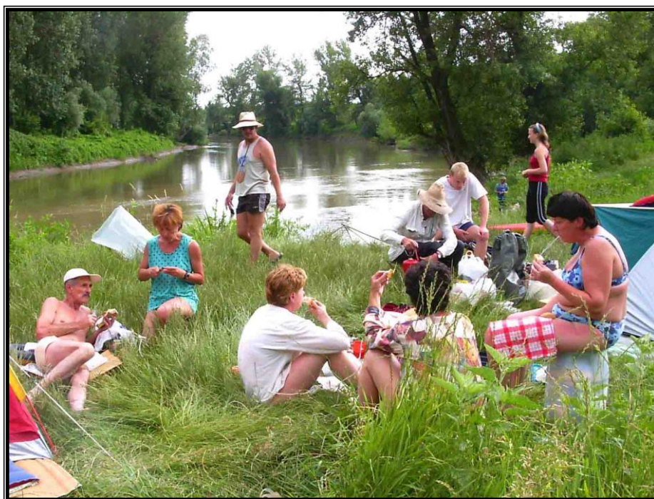
Kép 14: Szalonnasütés Kesznyéten mellett. Háttérben a Sajó