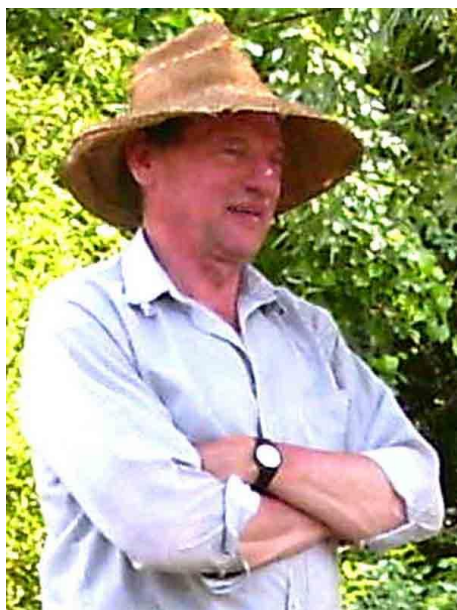
Kép15: Hadd lássam csak azt a beszállást!

történik az eset, talán rajta is maradt volna a név. Így azonban másfél óra múlva kikötöttünk és a semmiből előtűnt név a semmibe tűnt tova.