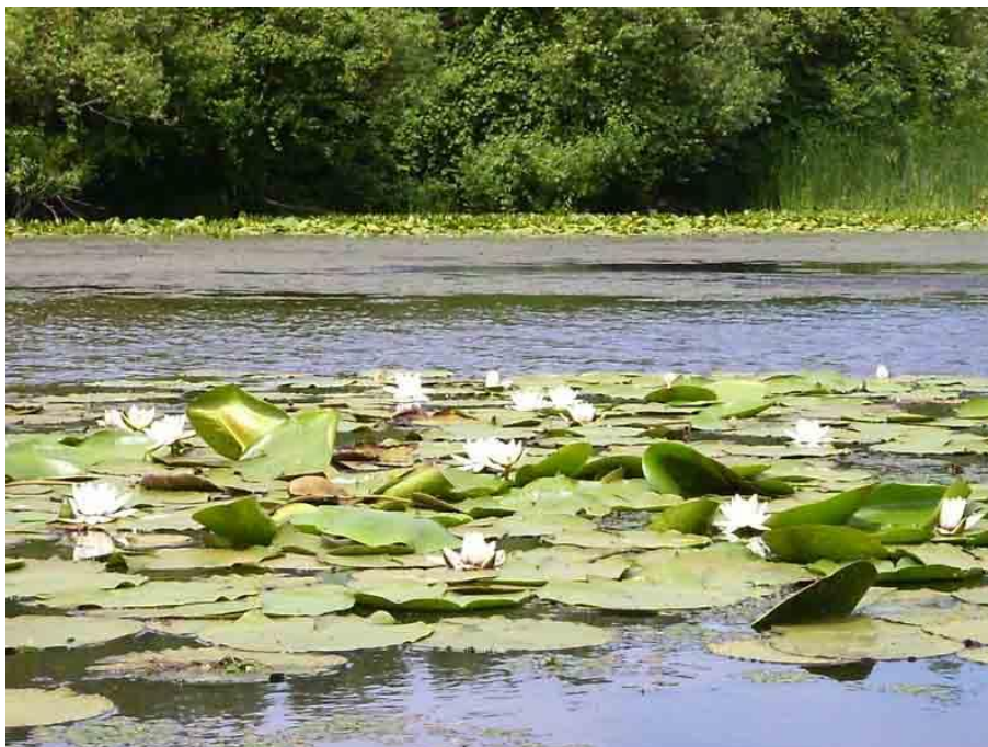
Kép 18: Fehér foltok lebegnek a vizen