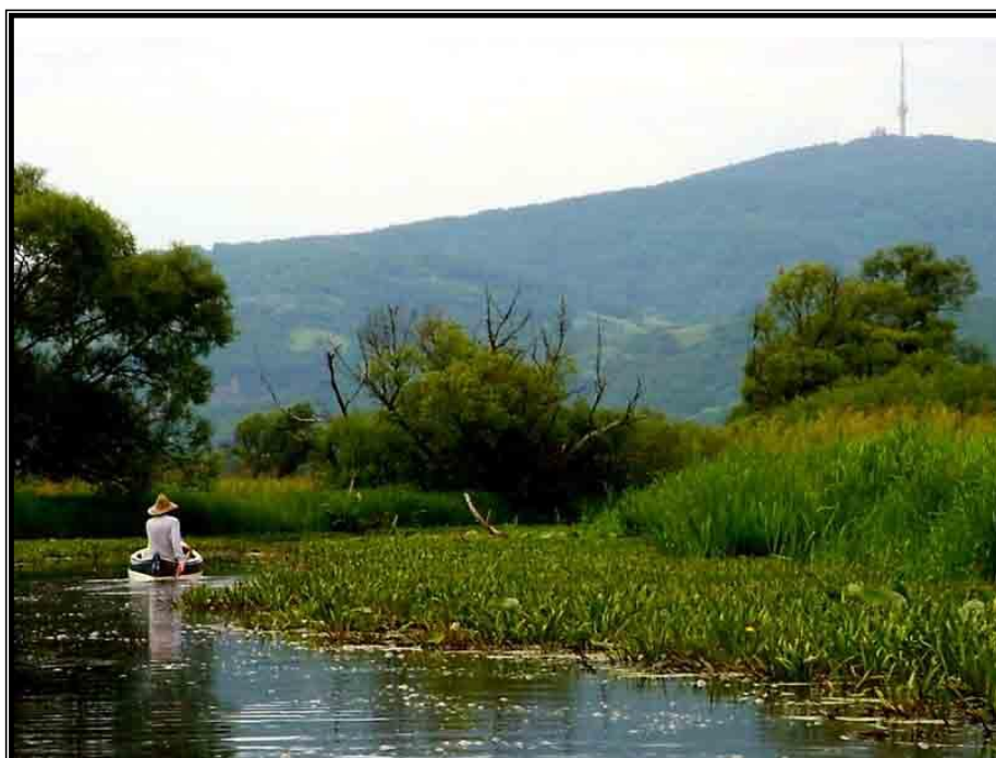
Kép 5: Előttünk a Nagy-Kopasz (itt éppen a Bodrog –ártéren)

És ez így ment még néhányszor. Ahányszor elénk került, mi feléje tartottunk...és egyre távolabb voltunk tőle. A rejtélyre nagyon egyszerű a magyarázat, csak meg kell nézni a térképet. A folyó kanyarulatai rendszeresen úgy fordulnak, hogy bár légvonalban egyre távolabb kerültünk tőle, bizonyos szakaszokon mégis feléje tartottunk. És persze a hegy is becsapós: minden oldaláról szinte ugyanazt a látványt nyújtja messziről. Így eshetett meg, hogy a hegyet magunk előtt látva a harmadik nap is az volt az érzésünk, mintha ugyanott lennénk, ahol a legelső nap voltunk.