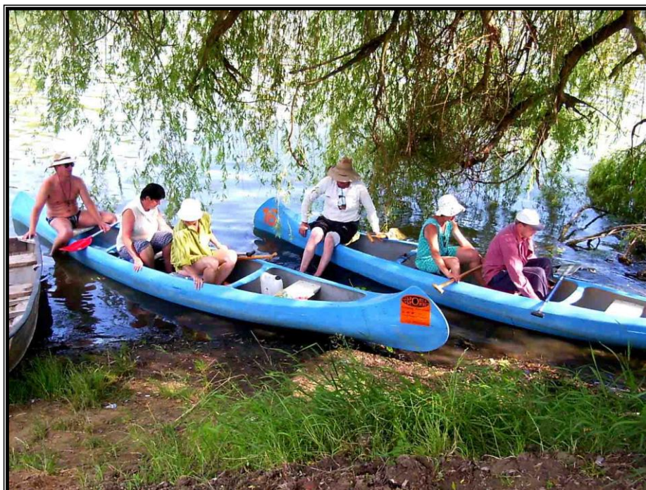
Kép 13: A „főúri” társaság megérkezik a kastélyhoz

sikerült úgy bezárnia, hogy csak a toronyszoba erkélyéről kiabálva tudta felhívni magára a figyelmet, és így tudott kiszabadulni.)