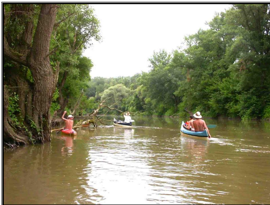
Kép 6: Felfelé a Sajón némi kapaszkodással.