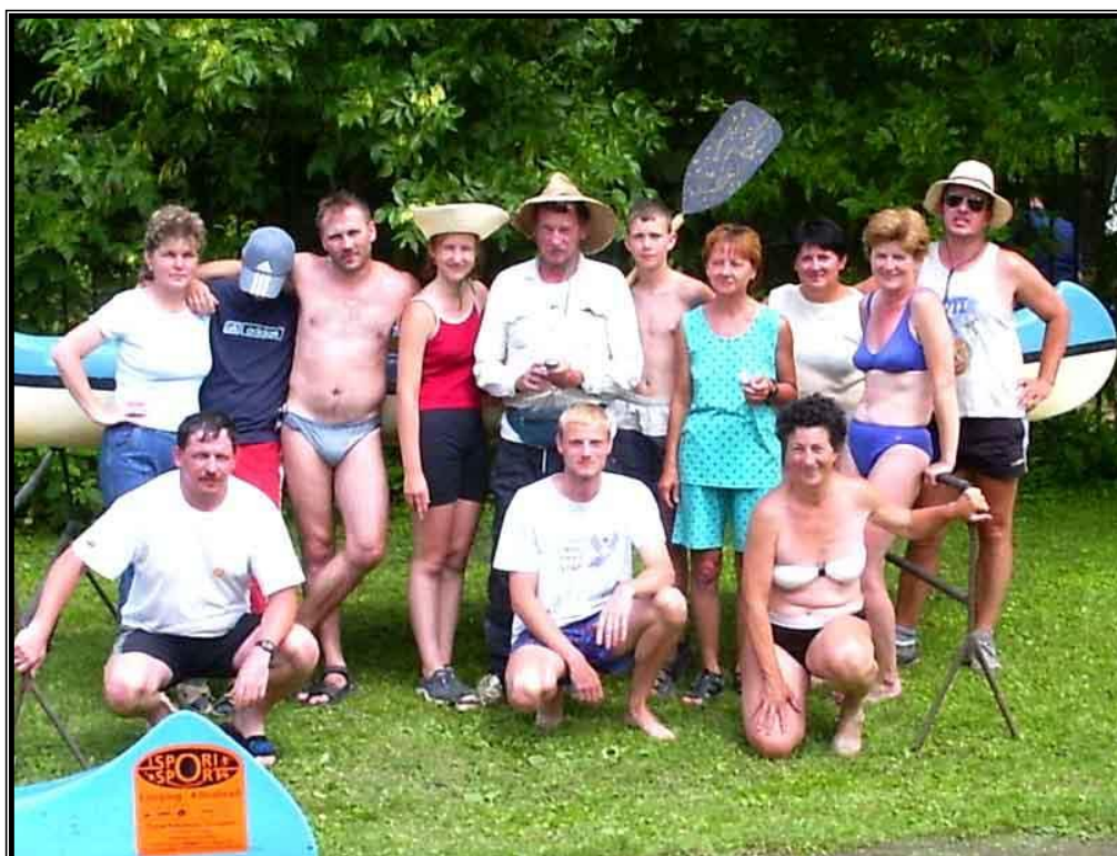
Kép 21: A csapat