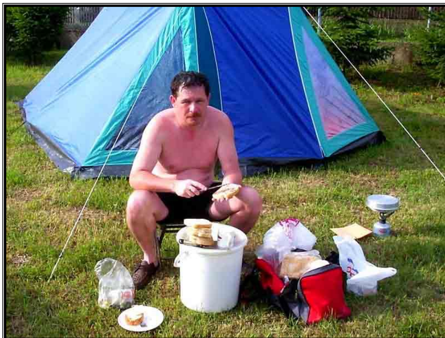
Kép 10: Asztal + küssék = összkomfort