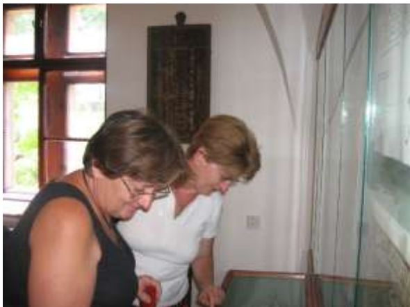
Lőcsén a Szepességi Múzeumban