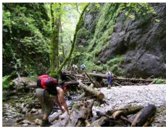
Néha négykézláb a megoldás