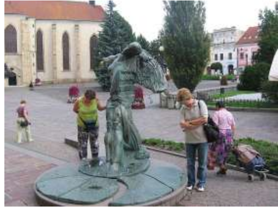
Eperjesen városnézés a régi városfal, és a főtér, a Szent Miklós templommal