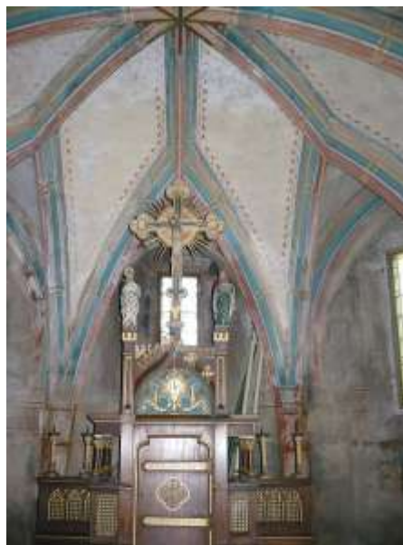
Végre ötödszöri próbálkozás után, megnézzük a csütörtökhelyi templomot