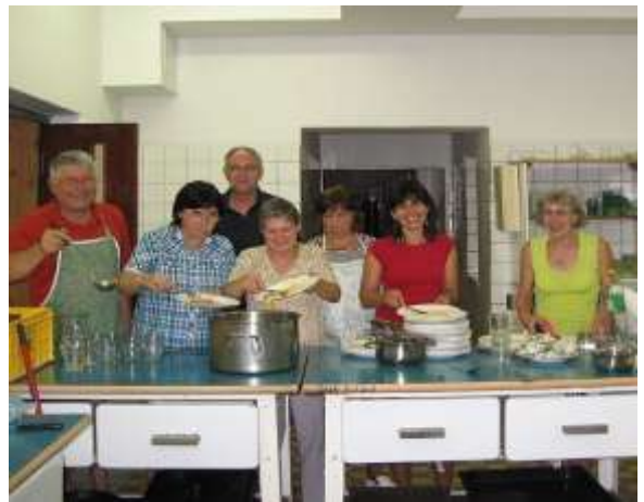
Vacsora utáni tájékoztató, bemutatkozások, és akik az ételeket készítik