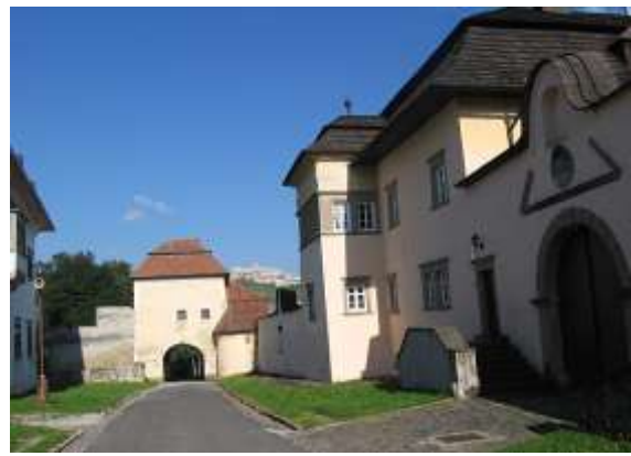
Szepeskáptalan egyetlen utcája