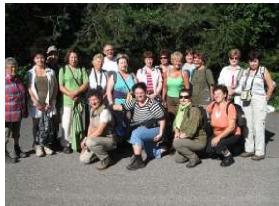
Maci csapat a Hernád-áttörés útját teljesítik, a Zergék még tovább mennek