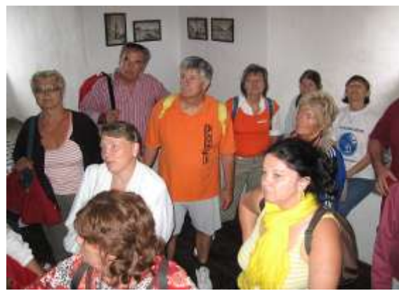
Iglón várjuk az idegenvezetőt, akivel felmegyünk, 78 m-es templomtoronyba