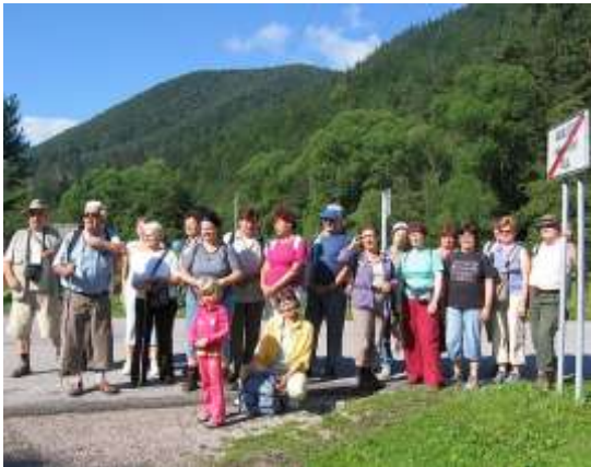
Szamócák és Macik a patak meder mentén haladnak Pilától Podlesokig