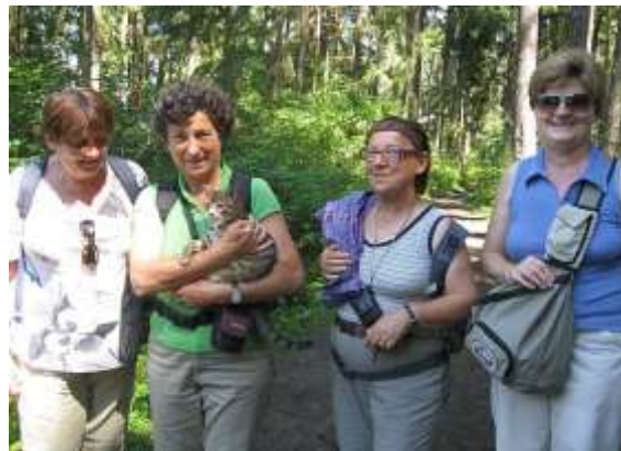
Kicsik, nagyok, szépkorúak és más állatfajta a kényelmes kirándulás végén