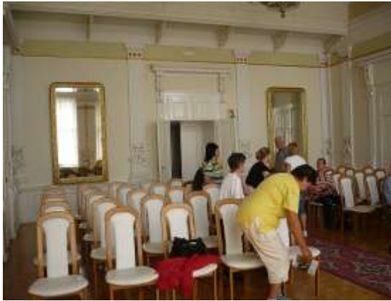
Igló a Városháza díszterme