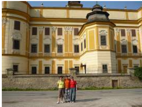
Márkusfalván pihenés, beszélgetés, iddogálás, sétálgatás, a kastély körül