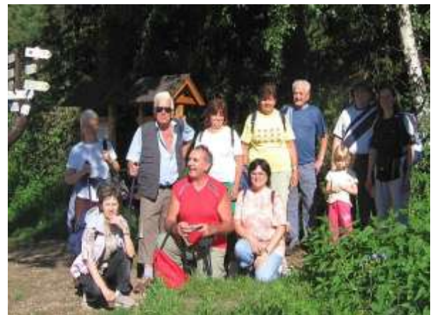
Csingoból indulnak a Zergék, a Macik, a Szamócák pedig hazasétálnak Tamásfalvára