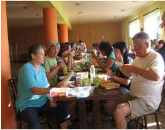
Bőséges, finom a reggeli