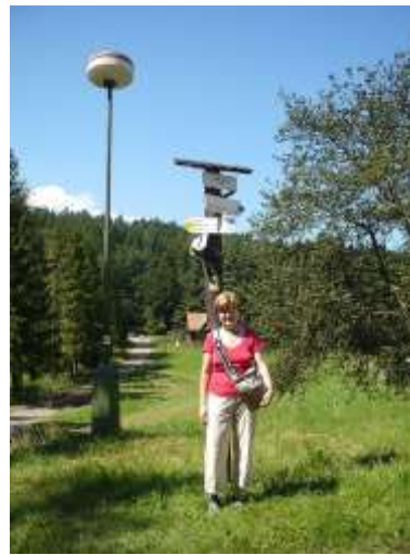
Szamócák és Macik is a Tamásfalvi-kilátóval ismerkednek