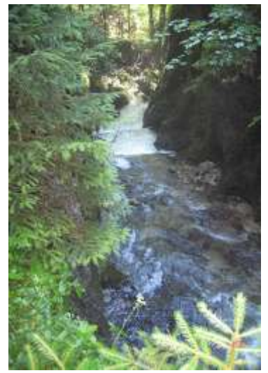
A szépségek tárházat szemléljük, ragyogó zöldek, víz, napfény és nyugalom