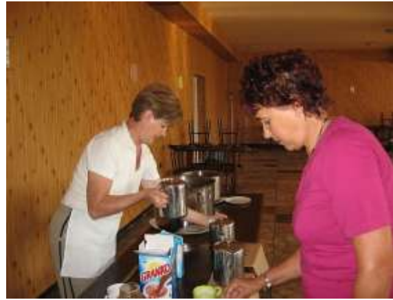
Munkában a naposok, kávézás