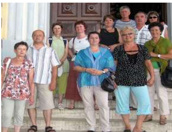
A kálvária templom lépcsőjén a viharos zápor előtt, majd indulás lefelé