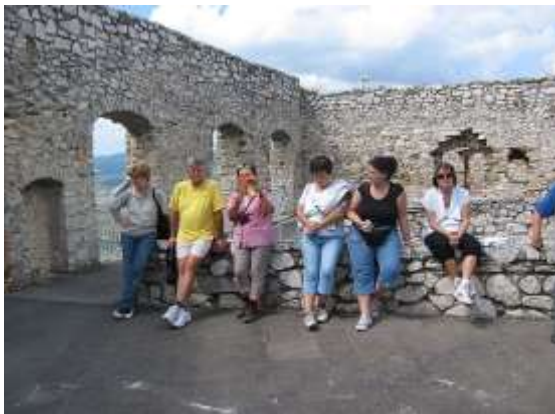
Ismertető Szepes várában