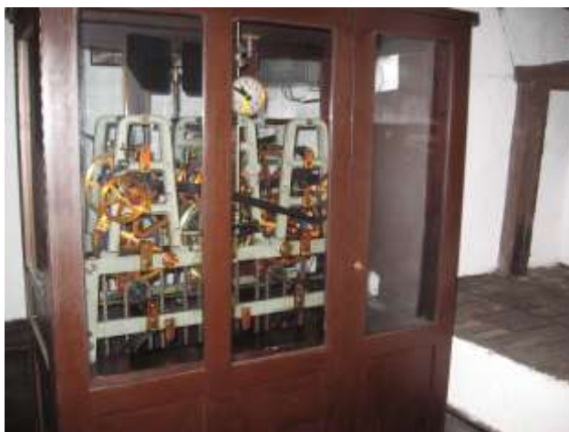
A toronyóra szerkezete

Evangélikus temploma 1790 és 1796 között épült copf, stílusban. Oltárképe: Krisztus az Olajfák hegyén S.G.Stünder olajfestménye, 1797-ből. A templombelső érdekessége, hogy az orgona mellett kialakított állványokon tárolják az egyház könyveit, mint egy könyvtárban.