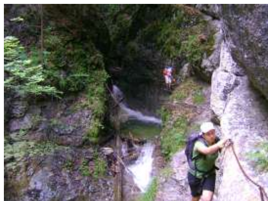
Zergék ismét az izgalmas szurdok úton haladnak, létrákon és láncok mellett