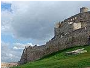
A román stílusú elővár

A tatárjárás idején, IV. Béla szorgalmazta a várépítéseket, ezért a szepesi vár területén 1249. szeptember 19.-én a szepesi püspöknek egy területet ajándékozott, ahol saját költségén felépíttethetett egy tornyot és egy palotát. Ekkor keletkezett a helytartói palota, ez az első hozzáépített objektum az eredeti várhoz. Ez az adománylevél a szepesi vár első írásos említése. A prépost megépítette a külső várudvart a tornyos bejárattal, lakóépülettel és külső várfallal. A század végére azonban a közeli szepesi káptalanba költözött, így két jelentős közigazgatási központ is működött, a szepesi káptalan – egyházi jelleggel, és a szepesi vár – világi jelleggel. A vár a vármegye központjává vált, a mindenkori szepesi ispánok székhelye lett, gyakran jelentős személyiségek lakhelye. A 13. század második felében a vár körül számos csatát vívtak. 1275-ben a király ellen fellázadt Roland comes (szepesi ispán) foglalta el. Ezután Kun Erzsébet, IV. (Kun) László király anyjáié volt. A vár birtoklásáért a 14. század első felében is harc folyt. 1304-ben Károly Róbert hívei foglalták el Vencel híveitől. 1307-ben rövid időre a csehek szállták meg, 1312-ben Csák Máté akarta elfoglalni, de a védők megvédték a várat.