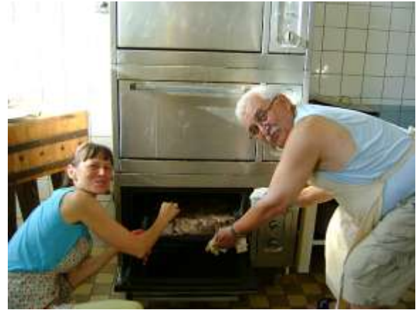
Vidám hölgyek gyűrűjéből nem menekülhet a főszakács, csak a sütőig