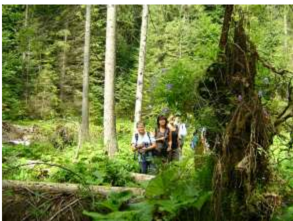
A Zergék hosszú szurdok völgyi túrája