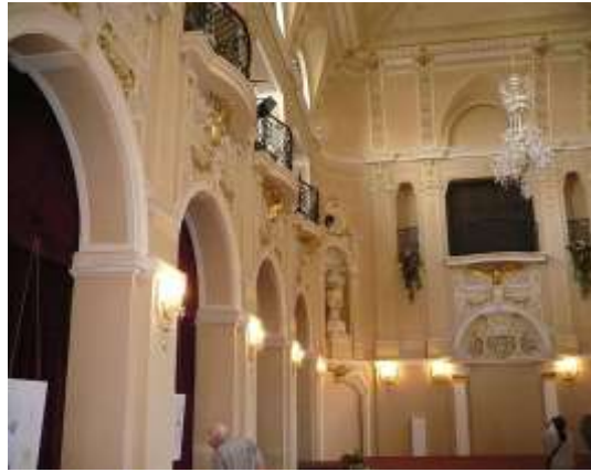
A Vigadó díszterme