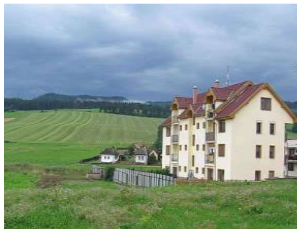
Tamásfalva régi háza és új lakóépülete, háttérben a Szlovák Paradicsom hegyei