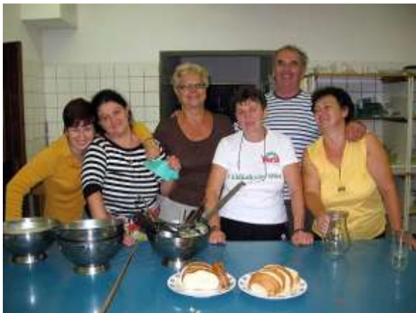
A nap konyhatündérei és eredményei az üres tányérok, a mosolygós tekintetek