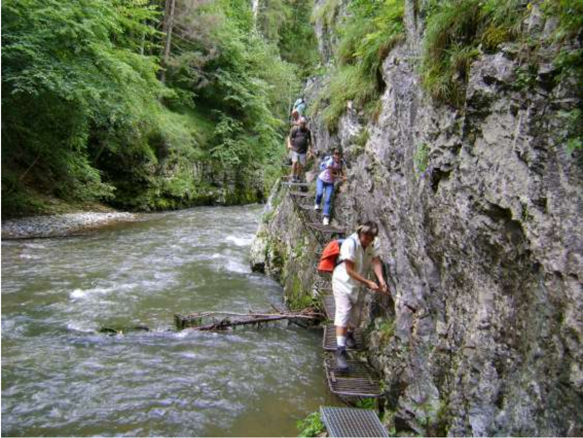
A FÖLDI PARADICSOMBAN 2010.08.07.-08.14.