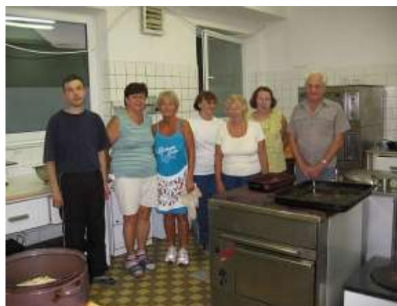
A nagy sárga bálna azért mindenhová elvisz A nap szorgalmas főzőbrigádja

4. Nap: mindenki túrázik Szamócák és Zergék Pilától Podlesokig a völgyben, rövidtúráznak. Zergék ismét a szurdokok felé indulnak.