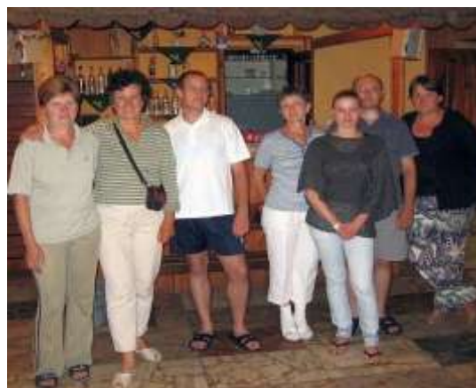
Munka közben két szakács, és az elvégzett feladat után a teljes csapat